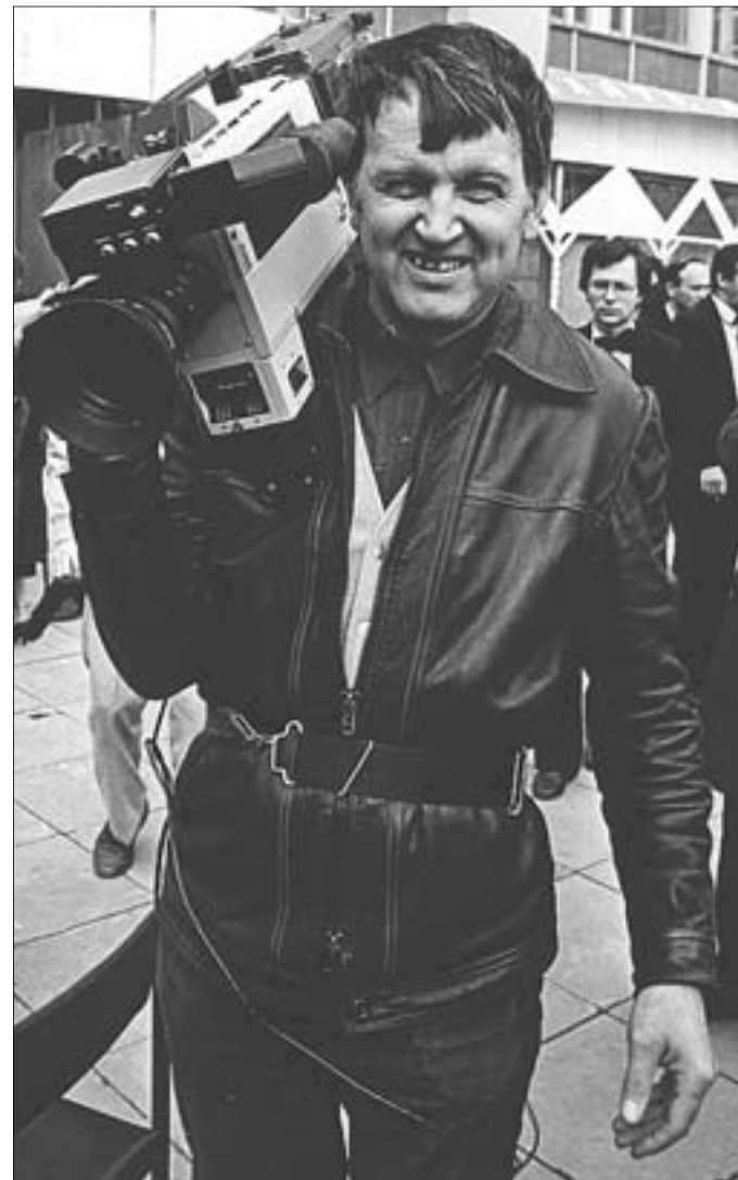
Кинооператор Виль Абузьяров с первым отечественным ТЖК. 1992 г.