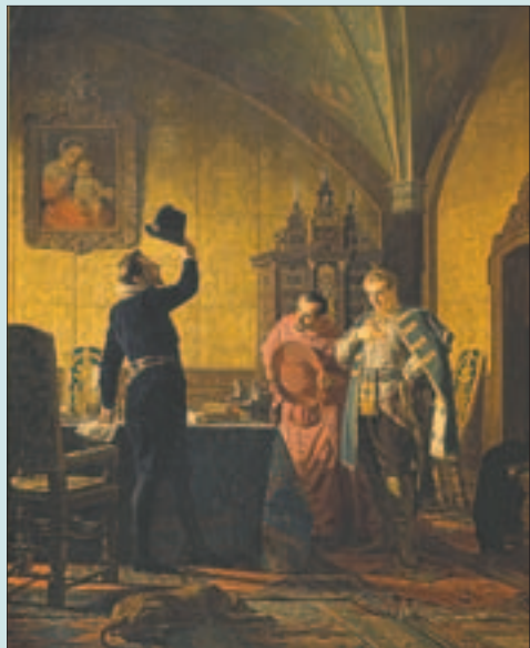
Н.В. Неврев. Присяга Лжедмитрия I польскому королю Сигизмунду III